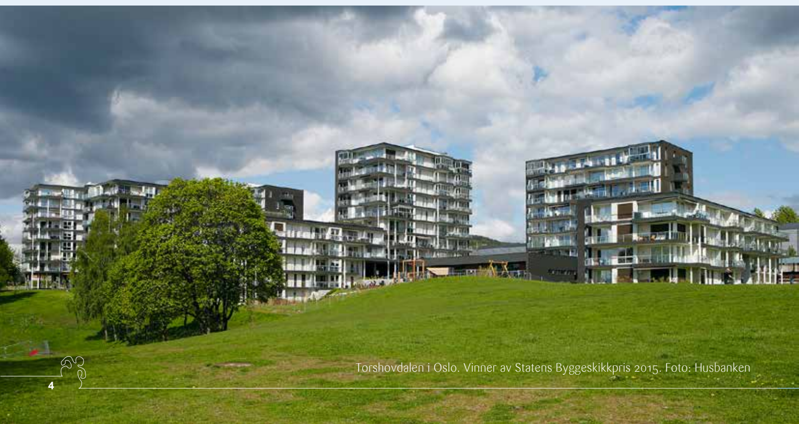
Torshovdalen i Oslo. Vinner av Statens Byggeskikkpris 2015.

Framover ønsker Husbanken å være anerkjent og tydelig, helhetstenkende og framoverlent. Ved endt strategiperiode har Husbanken gjennom sin supplerende rolle i boligmarkedet økt andelen som bor i varige og egnede boliger.